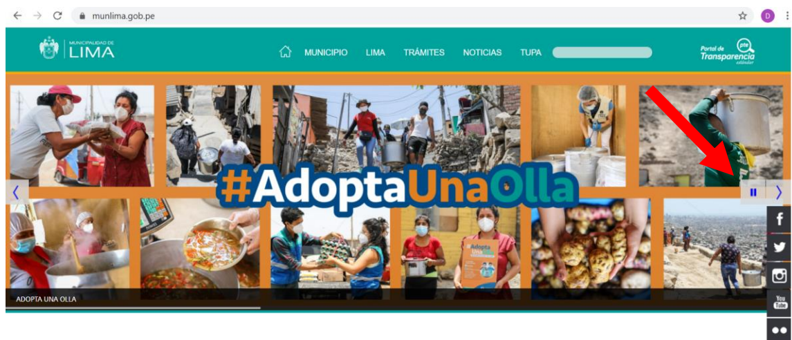
(Imagen de slider de “Adopta una Olla”, tras seguir el menú deslizable)

Al hacer clic en el encabezado de “Adopta una Olla”, se redirige al landing www.ollascomunes.gpvlimas.com/public , en el que está alojada la información principal