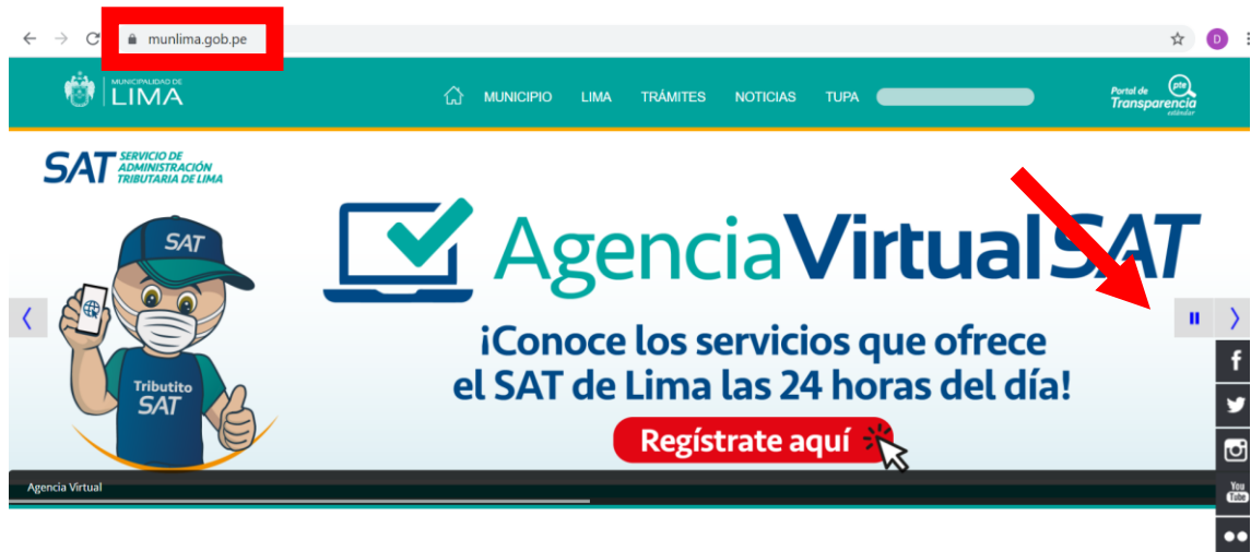
(Imagen de slider en la web de la Municipalidad de Lima)

En primer lugar, abrir el dominio www.munlima.gob.pe . El slider de la página tiene un menú deslizable. Al hacer clic allí se encuentra el encabezado de la campaña “Adopta una Olla”, que forma parte de la iniciativa municipal “Manos a la Olla”, bajo la cual se hacen las entregas de insumos alimenticios a las ollas comunes.